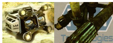
水中フォトグラメトリSLAM