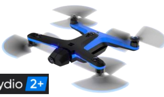
AI搭載自立飛行型ドローン