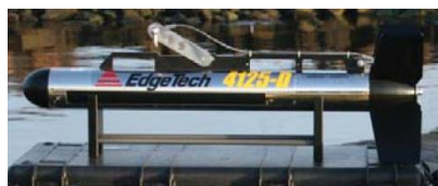
サイドスキャンソナー