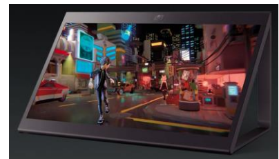
SONY製 空間再現ディスプレイ