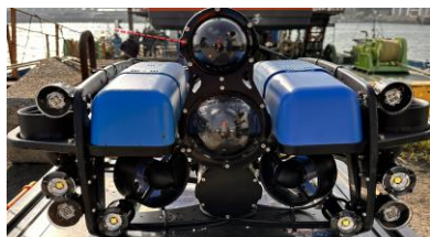
水中用赤外線カメラ