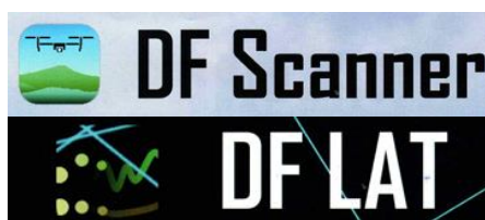
DeepForestTechnologis社製 ドローン森林情報解析ソフトウェア

ご紹介できる一部の製品を掲載しております。 掲載以外の製品でご要望がございましたら、お気軽にお問い合わせ下さい。